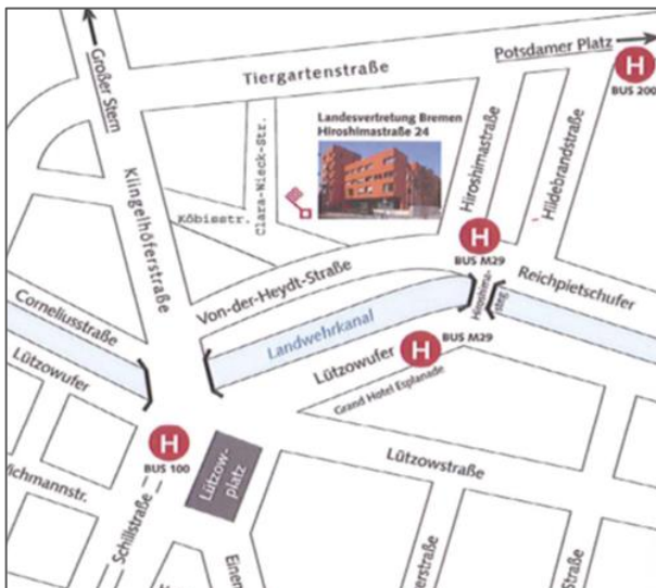
Lage Gästehaus Landesvertretung Bremen

Für Fragen erreichen Sie uns unter: Tel.: 030/26930-34928